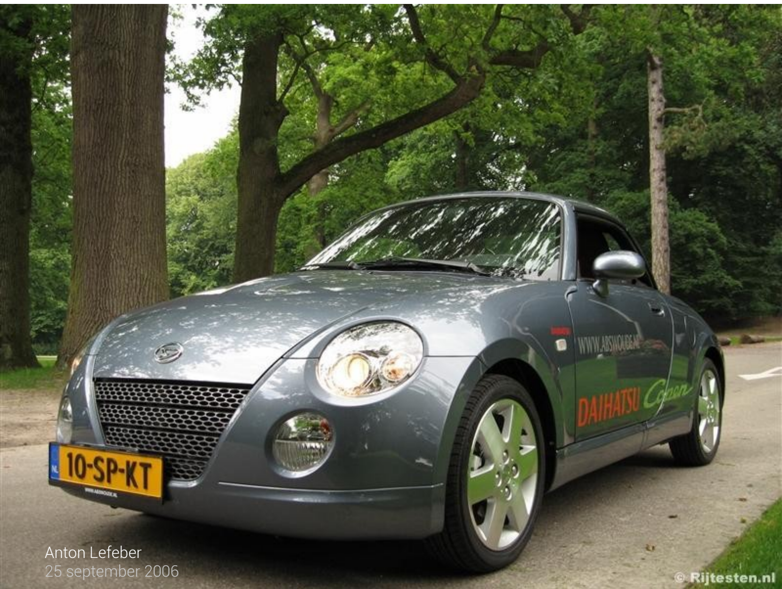
Anton Lefeber 25 september 2006