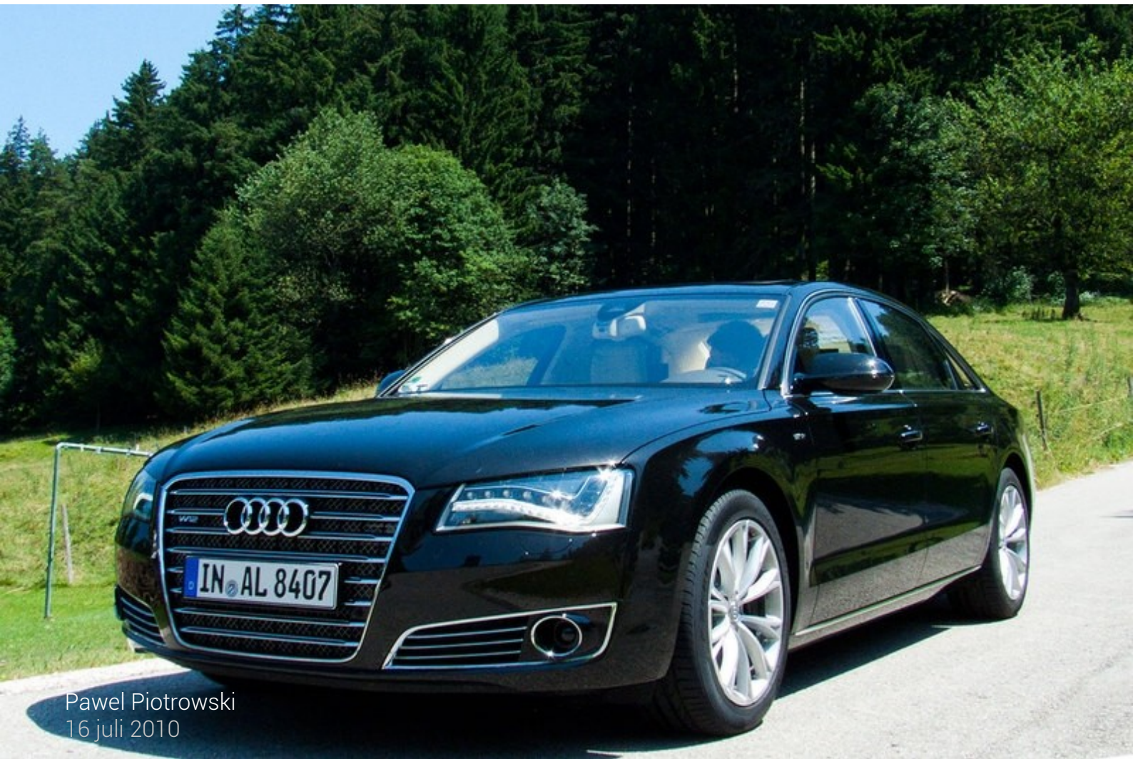
Pawel Piotrowski 16 juli 2010