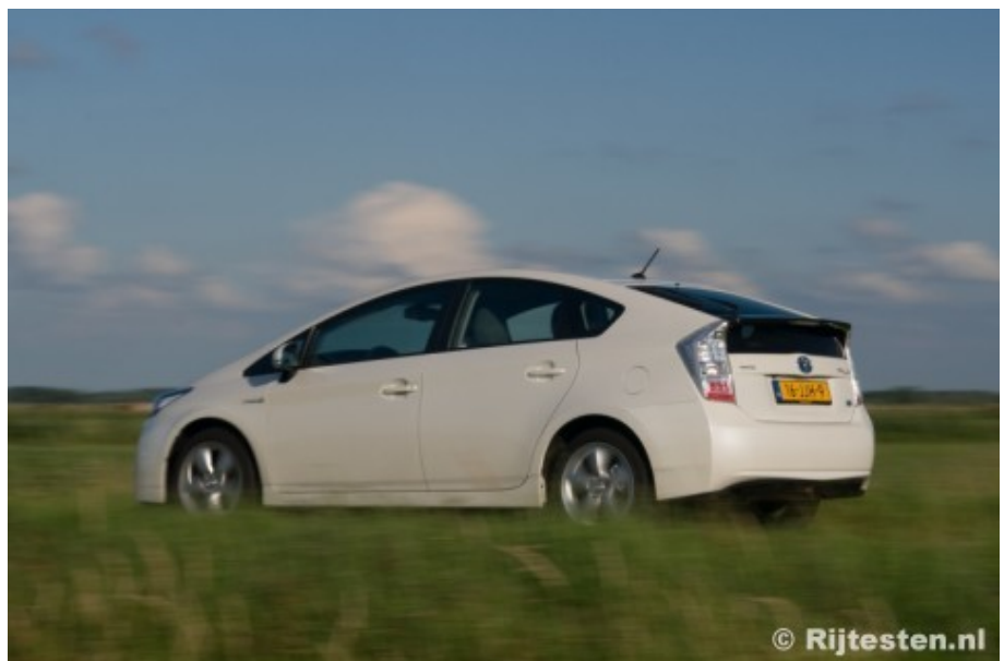
Het comfort van de Prius is prima, de wegligging had beter gekund.