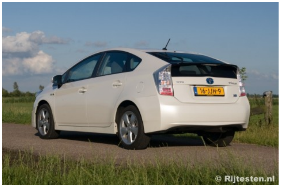
Het nieuwe model oogt minder ongewoon dan zijn voorganger.

Net als de vorige Priussen, ziet de nieuwe er bijzonder gestroomlijnd uit. Dat blijkt hij ook te zijn: met een weerstandscoefficient van slechts 0,25 (ter vergelijking: een Porsche 911 'scoort' 0,28) is hij een van de meest gestroomlijnde productieauto's ooit. Toch oogt het nieuwe model minder extreem dan de eerste twee generaties. Zo ziet hij er van voren heel normaal uit, met zijn grote luchthapper doet de neus zelfs een beetje sportief aan. Ook de achterzijde is beter te pruimen dan voorheen. Nu het spoilerletje niet in de carrosseriekleur is gespoten, valt deze minder op. De licht oplopende schouderlijn geeft hem iets stoers. Sowieso maakt het zijaanzicht een minder oubollige indruk dan bij het vorige model.