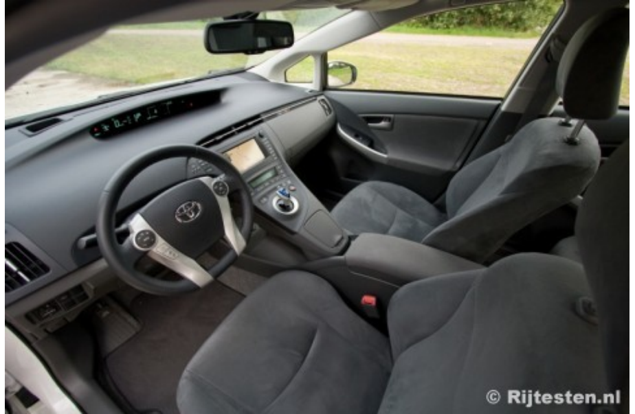
De futuristische uitstraling van het dashboard past goed bij de Prius.

Dat de Prius de auto van de toekomst is, blijkt wel uit het futuristische dashboard. Met een groot digitaal instrumentarium in het midden, een zwevende middenconsole en een opvallend klein blauw automaatpookje, is het interieur alles behalve alledaags te noemen. Het is alleen jammer dat het plastic ouderwets hard is, in zo'n vooruitstrevende auto mag je beter verwachten. Dat plastic is overigens gemaakt van organische materialen zoals zeewier. Qua ruimteaanbod scoort de Prius heel aardig. Vanwege de korte overhangen is de wielbasis – en daarmee de interieurruimte –