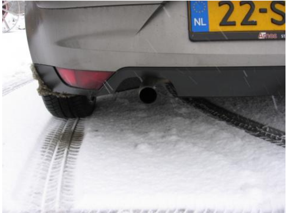
Sinds modeljaar 2006 geen dubbele uitlaat meer voor de 1.9 TDi

Door de weersomstandigheden tijdens de test heb ik het bochtgedrag niet tot op het bot kunnen testen. Maar wat ik wel heb kunnen ervaren is positief. De Altea helt nauwelijks over en heeft zo goed als geen last van onderstuur als de bestuurder de bocht uitacceleert. De vering en demping is in deze Businessline (gebaseerd op de Stylance) op comfort afgestemd. Alle oneffenheden in de weg worden onmerkbaar verwerkt. Meer sportievere rijders zullen aan de Sport-Up-versie met sportonderstel en optioneel 17-inch lichtmetaal vast meer plezier beleven.