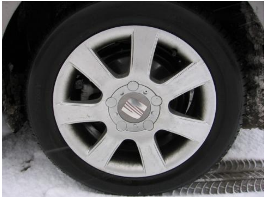
16-inch Polaris lichtmetalen velgen

De term "Multi Sports Vehicle" die Seat aan de Altea geeft komt bij deze 1.9 TDi Businessline niet overdadig naar voren. Daar is toch echt een Sport-Up met 2.0 FSi met 150 pk of 2.0 TDi met 140 pk voor nodig. Het onderstel kan duidelijk meer aan dan de kracht die de testauto levert. Desondanks is het een zeer comfortabele en best vlotte auto die er blits bij staat. Voor een prijs van € 28.635 mag er natuurlijk best wat verwacht worden. Op het gebied van standaarduitrusting pakt de Altea Businessline dan ook punten. Navigatie, parkeersensoren en regensensor bijvoorbeeld zijn aanwezig. De concurrentie bestaat uit onder andere de Ford Focus C-Max, Peugeot 307 SW en Renault Scénic. Met vergelijkbaar vermogende motoren kosten deze auto's eveneens rond de 28 à 29 mille.