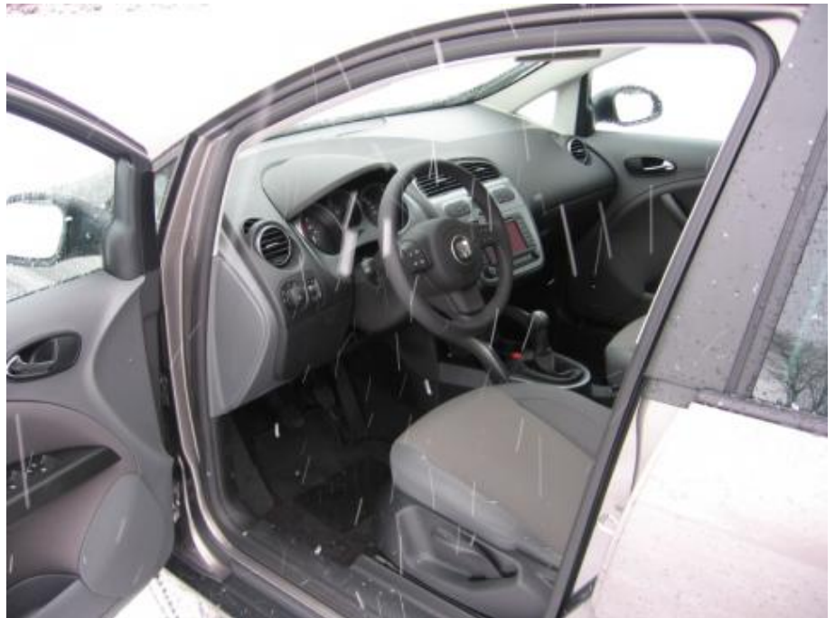
Veel grijstinten, maar de vormgeving is geslaagd

Omdat Seat de Altea niet teveel op een busjes-mpv wilde laten lijken is de instap geen klimoefening maar is deze slechts enkele centimeters hoger dan in een middenklasse hatchback. De bestuurdersstoel is ook lekker diep instelbaar. Mede door de hoge raamlijn geeft dit een geborgen gevoel. Het stuurwiel is lekker ver naar je toe te halen wat het gevoel van controle over de auto vergroot. De voorstoelen zitten comfortabel en zijn ruim van afmetingen. Eveneens comfortabel, zeker bij het schakelen, is de middenarmsteun waaronder zich in de Businessline-uitvoering een 6-CD-wisselaar bevindt. Deze