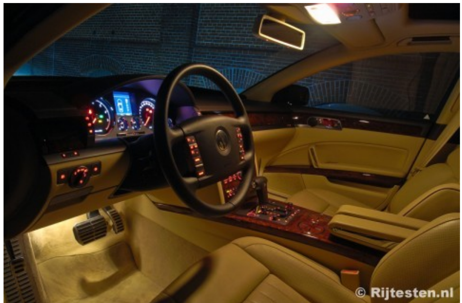
Exclusief materiaalgebruik voor de Phaeton

Piëch wilde een auto die ook qua interieurkwaliteit de toon zou zetten. De afwerking en het materiaalgebruik is subliem en zeker ten tijde van zijn introductie veel beter dan de concurrentie. Helaas zitten deze merken op dit niveau echt niet stil. Vooral de nieuwe S-Klasse is de toonaangevende auto, maar die is dan ook veel nieuwer. Desondanks kan de Phaeton nog opvallend goed concurreren als je naar zijn leeftijd kijkt. Kenmerkend voor de Phaeton is het ingenieuze airconditioningsysteem. Piëch heeft een hekel aan tochtende airco's en dat moest de Phaeton dus absoluut