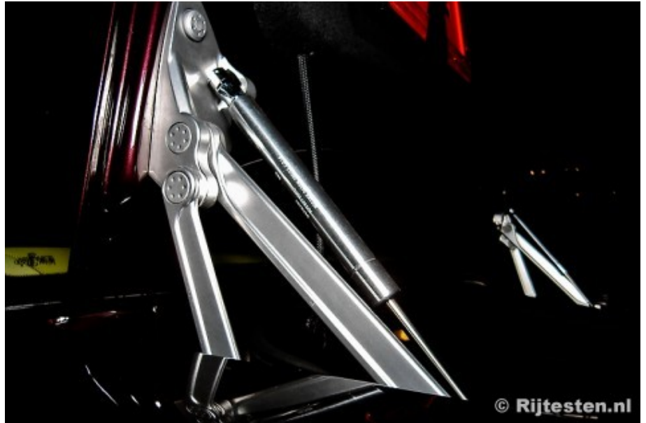
Prachtig vormgegeven scharnieren in de achterklep

Het is een exclusief genoeg om te rijden met een Phaeton. Hij is zo zeldzaam als een witte raaf en je moet maar durven om deze "über-Passat" tussen de S-Klasses en 7 Series van deze wereld te parkeren. Hij doet niets onder voor deze auto's, sterker nog, op een aantal punten scoort hij significant hoger, maar hij haalt niet de perfectie en de doelstellingen die Ferdinand Piëch gesteld heeft. Hij rijdt absoluut heel erg comfortabel en soeverein, maar hij zet de concurrentie niet op een zijspoor.