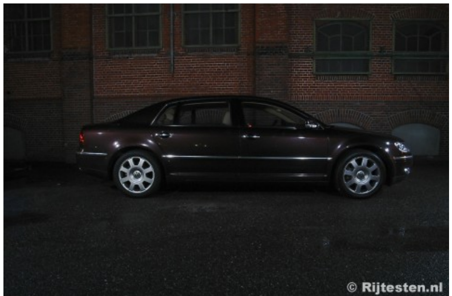
De verlengde uitvoering meet 5,17m van bumper tot bumper

2002 is het jaar van de marktintroductie van de Phaeton. De verwachtingen zijn hoog gespannen en Volkswagen heeft een auto beloofd die de wereld zou doen schokken. Al gauw blijkt dat de verkopen tegenvallen. In moederland Duitsland doet hij het nog redelijk goed, maar in de rest van Europa en daarbuiten moeten de verkoopprognoses naar beneden worden bijgesteld. "Het is een Audi A8 met een VW-logo" en "hij lijkt op een vergrote Passat" zijn veelgehoorde sceptische