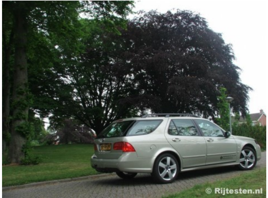
Stijlvol door het dagelijkse verkeer.

Standaard, en ik zeg met opzet 'standaard', heeft de 2.0t 150pk bij 5.500 tpm en 240 Nm bij 1.800 tpm. Daarmee haalt de 1.500 kg zware Estate in een respectabele 9,8 seconden de honderd kilometer per uur. En met deze gegevens in zijn achterhoofd, begon deze testrijder aan de proefrit. Het viel behoorlijk snel op dat de testauto wel heel erg snel was, voor een 150 pk sterke twee liter met dit gewicht. Het eerste vermoeden was simpelweg het redelijk hoge koppel en mogelijk een gunstige overbrengen. Pas tijdens het nagesprek met de verkoper kwam ter sprake dat er een software aanpassing was verricht.