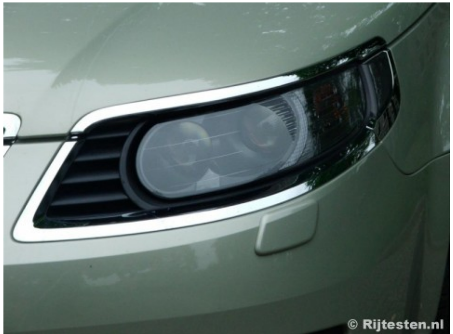
Het is en blijft een kwestie van smaak.

Met viermeter vierentachtig is de deze Estate van een gemiddelde lengte in deze klasse. Met deze lengte is deze auto exact even lang als de Opel Vectra. De reden ligt voor de hand, beide auto behoren tot de GM-familie en delen het platform waarop ze zijn gebouwd. De klassiek gestylede estate werd in 2005 volledig gefacelift. De meest opvallende vernieuwing van dat moment waren de chromen randen rond de koplampen. Saab noemde deze toevoeging zelf 'gedurfd', maar het verschilt per kleur hoe opvallend die randen zijn. Lichte kleuren en vooral zilvergrijs doen het erg goed op de 9-5. Een andere oplossing is om het chroom zelf te laten spuiten in de kleur van de rest van de auto. Of je kiest ervoor om gewoon lekker op te vallen en je te onderscheiden van de massa. Daarnaast, als je achter het stuur zit heb je geen zicht op de koplampen. Chroom is nu eenmaal iets wat op de juiste manier gebruikt moet worden; het kan een waardevolle toevoeging zijn aan de styling van een auto, maar het kan er ook uitzien als de bril van Dame Edna Average. Het zal echt een kwestie van smaak zijn of je wel of niet waardering kunt opbrengen voor dit deel van de 9-5. Nieuw en verrassend was deze design richting trouwens niet, in 2001 kwam Saab het de 9X conceptcar, die al reeds voorzien was van deze spiegelende delen.