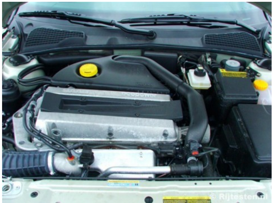
Goed voor 210 pk in plaats van 150 pk dankzij een kleine aanpassing.

De basis 2.0t business staat in de prijslijst vanaf € 45.195,-. Aan de testauto zijn als opties toegevoegd: Colourpack (€300,-; deurgrepen, portierbescherming in kleur), Dakrails (€300,-), Lichtmetalen velgen 17 inch (€ 300,-), Metallic lak (€ 1.100,-), Elektrisch verwarmde stoelen (€ 450,-), Hout accenten (€ 450,-), Lederen bekleding (€ 2.500,-), het Audio systeem 4 (95audio4; € 950,-), de Hirsch performance aanpassing (€ 1.350,-), de kosten voor het rijklaar maken (€ 975,-), de verwijderingsbijdrage (€ 15,-) en de leges voor de tenaamstelling (€ 46,-). Tezamen komt dat op een totaal van € 53.930,25.