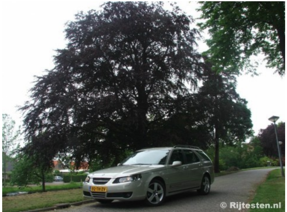
Onbekend maakt ongeliefd maakt exclusief.

De reclamemakers zijn er duidelijk over: Saab is een merk voor aardige mensen. Een merk voor personen die het liefst in een 'kan wel, maar hoeft niet zo nodig' auto rijden. Een auto dus die de reserve heeft om al het gros van de andere merken op een simpele en kordate manier kan overtroeven. Feit is dat Saab, net als Subaru, vooral een liefhebbersmerk is en dat leaserijder en kopers veel vaker voor de populaire merken kiezen. Als je dus minder populair bent, moet je jezelf extra bewijzen om te laten zien dat je het waard bent om gekozen te worden.